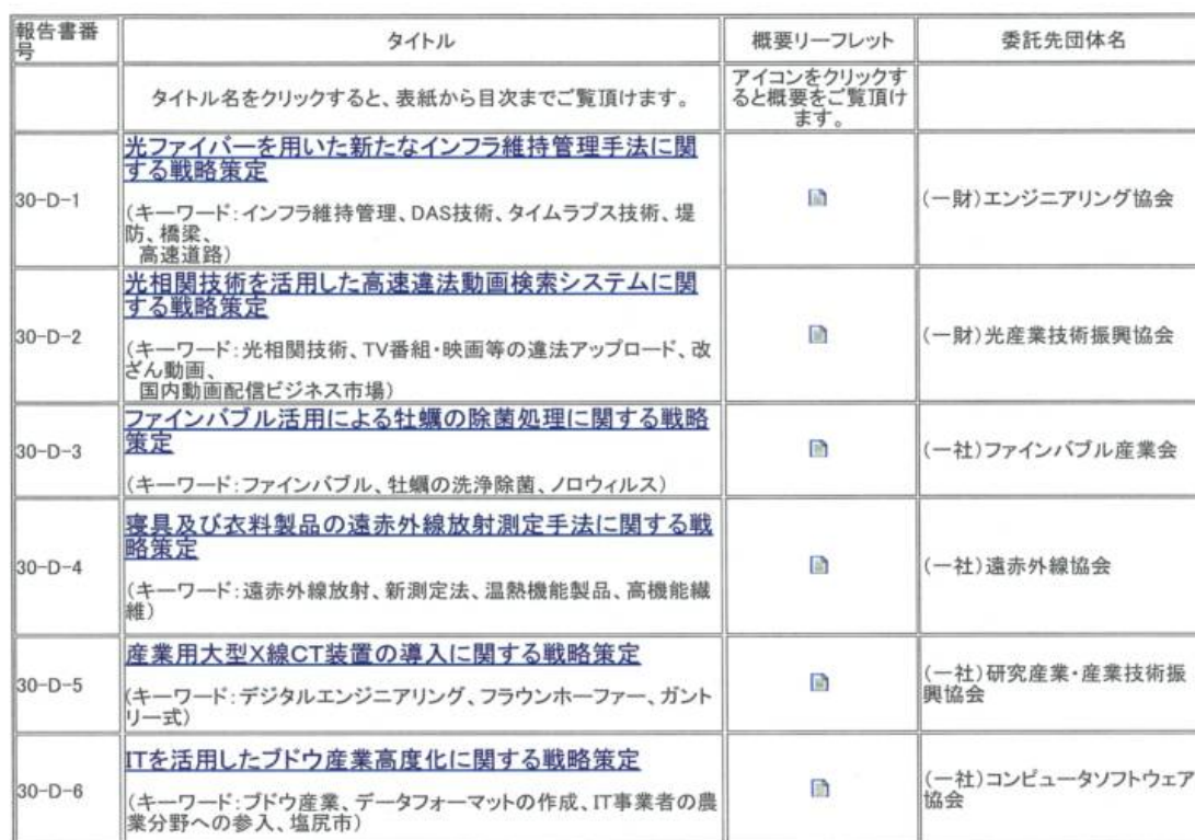
2018年度(平成30年度)報告書一覧

当協会ホームページの報告書一覧の画面(2018年度分を例示)、URLは以下の通りです。